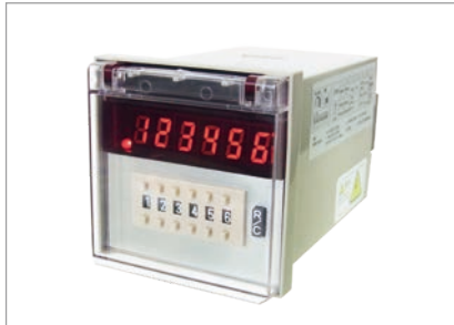
定格仕様 (種類ごと)