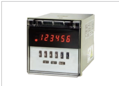
定格仕様 (種類ごと)